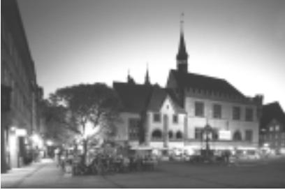
Das Alte Rathaus

In Göttingen spielt sich noch immer ein großer Teil des städtischen Lebens innerhalb des alten Stadtwalls ab. Das Nachtleben konzentriert sich auf wenige Straßen, die deshalb umso belebter sind. Alle wesentlichen Orte lassen sich zu Fuß erreichen. Ob es der Alte Botanische Garten ist, das Deutsche Theater oder eines der zahlreichen anderen historischen Gebäude, selten ist der Weg länger als zehn Minuten.